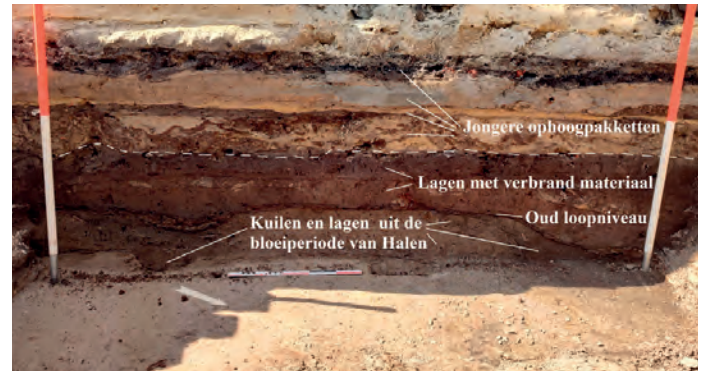
Gelaagdheid ondergrond met aanduiding